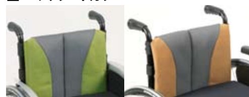
グリーン / ブラック ブロンズ / ブラック *仕様によってはブラックのノーマルシートになります。