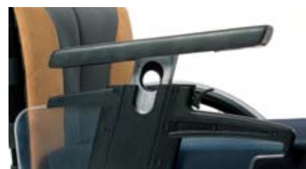
アームレスト付きサイドパネル

このサイドパネルは、後方へはね上げ、取り外すことができるため、ベッドやトイレ等への移乗やトランスボードを使用しての移乗にも便利です。また、パネルの上部にあるアームレストは、身体や状況に応じ、ワンタッチで高さの調整が行えます。