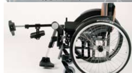
エレベーターフットレスト

骨折などにより車いすを使用する際に、足を上げた状態に保つ必要がある方のために、様々な角度で膝下部分を保持することができるフットレストです。ノブを操作することで、楽に休息できる角度など、希望の角度にワンタッチでフットレストを設定することができます。