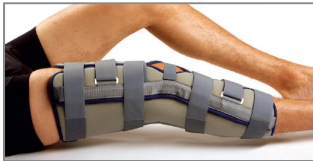
8062 ゲニューインモビル 20°（軽度屈曲位用）