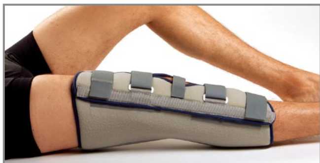
8060 ゲニューインモビル 0°（伸展位用）