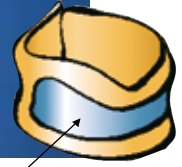
芯材にポリエチレンシート(1mm厚)で補強