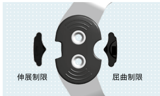
▶ 可動域調整を行う "Click 2 Go システム"

伸展制限: 0° / 10° / 20° / 30° / 45° 屈曲制限: 0° / 10° / 20° / 30° / 45° / 60° / 75° / 90°